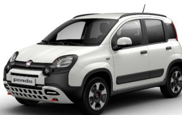
296 Gelato Weiss