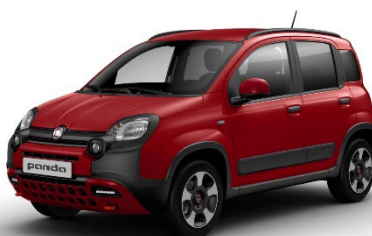
414 Amore Rot