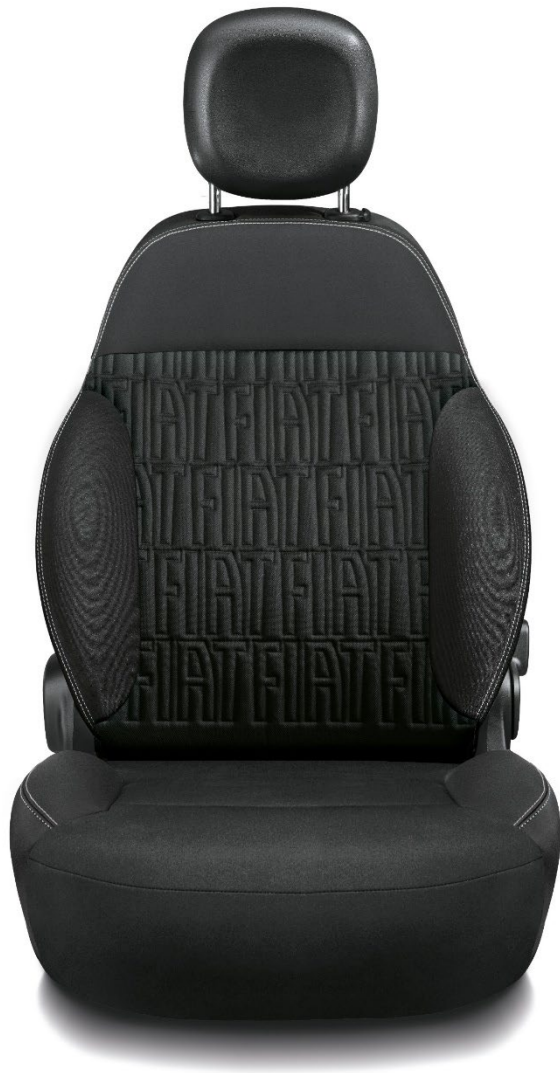
Schwarze Stoffsitze mit FIAT-Monogramm