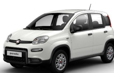
296 Gelato Weiss