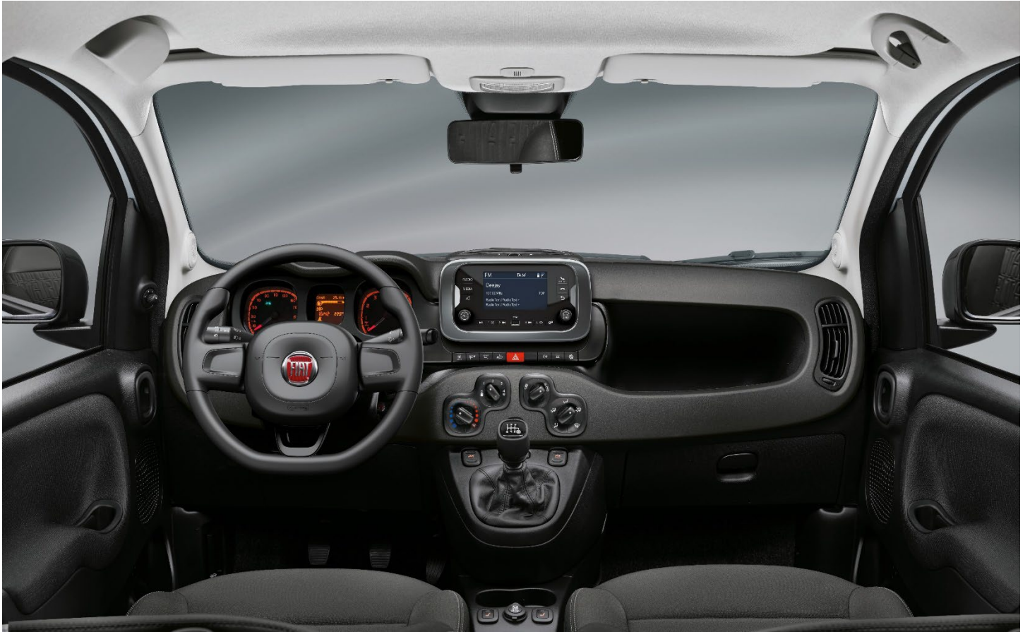
Cult / City Life