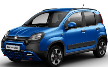
756 Italia Blau