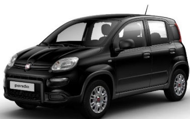
601 Cinema Schwarz