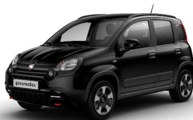
601 Cinema Schwarz