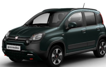
468 Foresta Grün