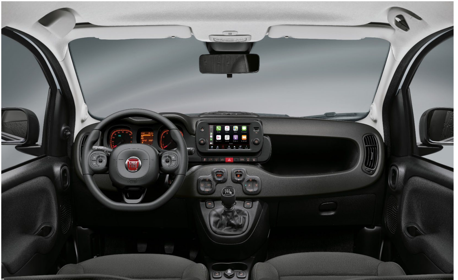
Pack City Life Plus / Cross