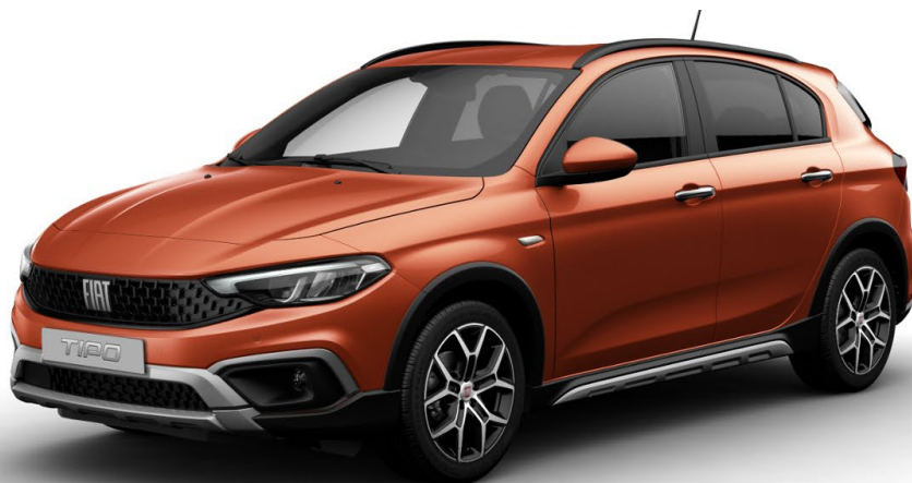
SWISS EDITION CROSS