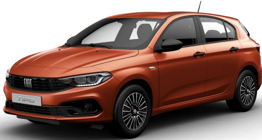
CULT – CULT EDITION