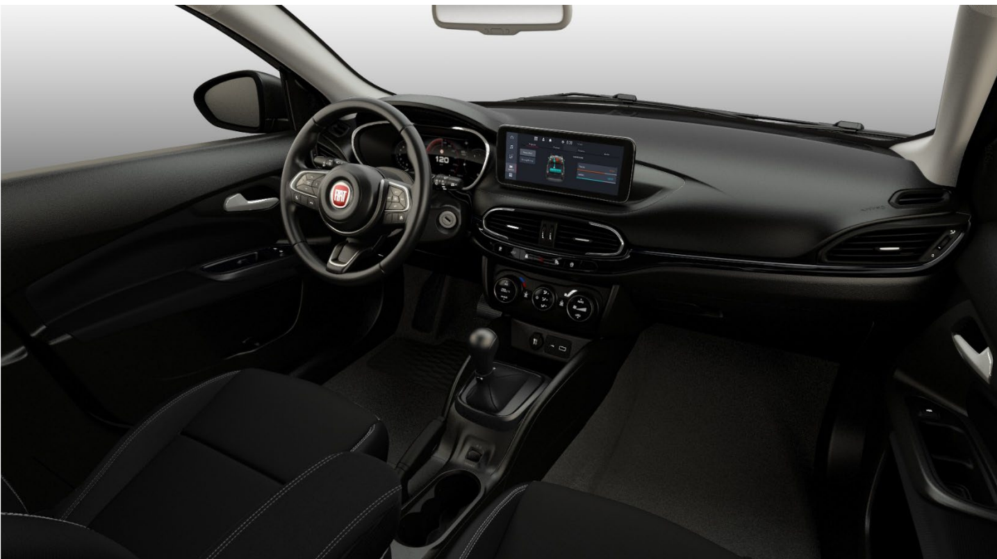
SWISS EDITION - SWISS EDITION CROSS